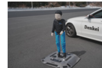
ADASテスト用の歩行者ターゲット