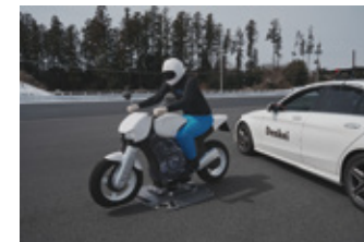
ADASテスト用のモーターサイクルターゲット