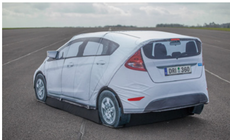
ADASテスト用の車両ターゲット