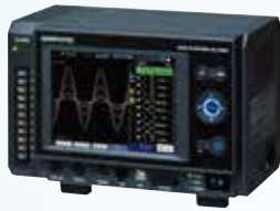
GL7000 本体 + 表示ユニット