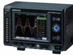
GL7000 本体 + 表示ユニット