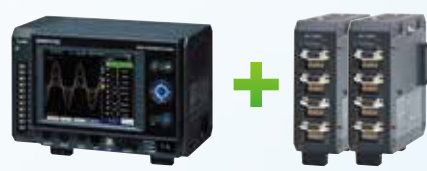
GL7000 本体 + 表示ユニット