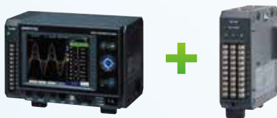
GL7000 本体 + 表示ユニット