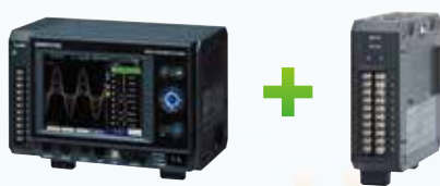
GL7000 本体 + 表示ユニット